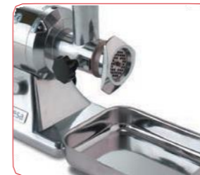
Con bandeja de recogida en acero inoxidable incorporada.