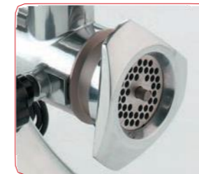
Detalle de la boca.