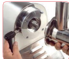
Modelo PI-32 con boca fácilmente desmontable para su limpieza.