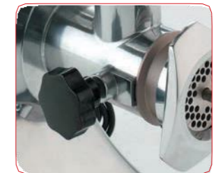
Completamente desmontable para una fácil limpieza.