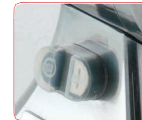
Interruptor marcha-paro con relé.