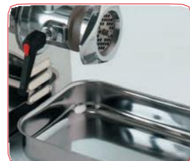
Bandeja de recogida en acero inox.