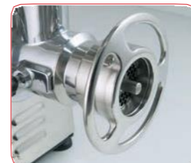
Detalle de la boca de la PI-22-U con sistema 1/2 Unger.